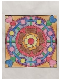
岡馬 スズイ様 まんだら塗り絵