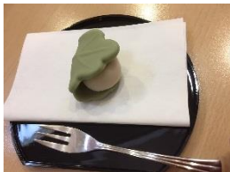
お菓子は、柏餅、炉は風炉になり初夏の趣を感じました。