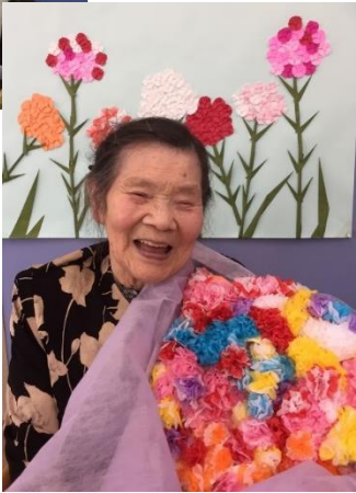
母の日にちなんで女性の皆さん に記念の撮影会をしました。