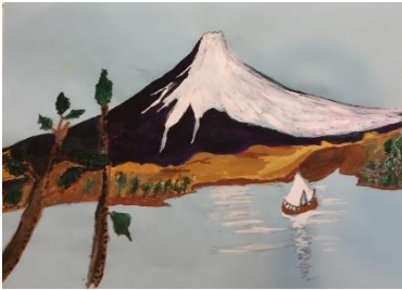
中川 正雄様 水彩画