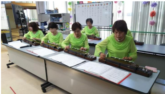
一年ぶりの演奏会です カトレアグループは上級者のクラス で、演奏もとても優雅で心から癒 されていきました。