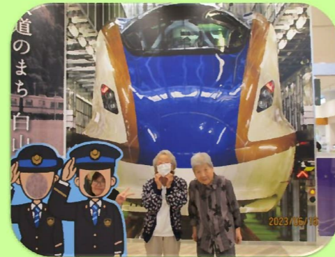
北陸新幹線のパネルにて記念撮

コロナ禍以前は年に一度希望されたご利用者様と一緒にショッピングに行っていました。今年はコロナの規制緩和もあり、久しぶりにイオン松任店または道の駅めぐみ白山のどちらかへショッピングに行っています。ご自分の目でたくさんの商品の中からどれにしようか品定めをして、家族に頼まれた商品を購入される方、家族みんなで食べられるようにと、お菓子をたくさん購入される方など、ショッピングを楽しまれておられます。ショッピングへの参加をご希望されてまだショッピングへ行っていない方も、是非楽しみにしててくださいね♪