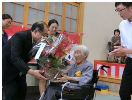
祝百二歳 泉様 (もくれんフロア)