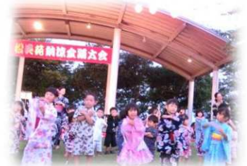
あゆみこども園の園児による 元気いっぱいのお遊戯披露