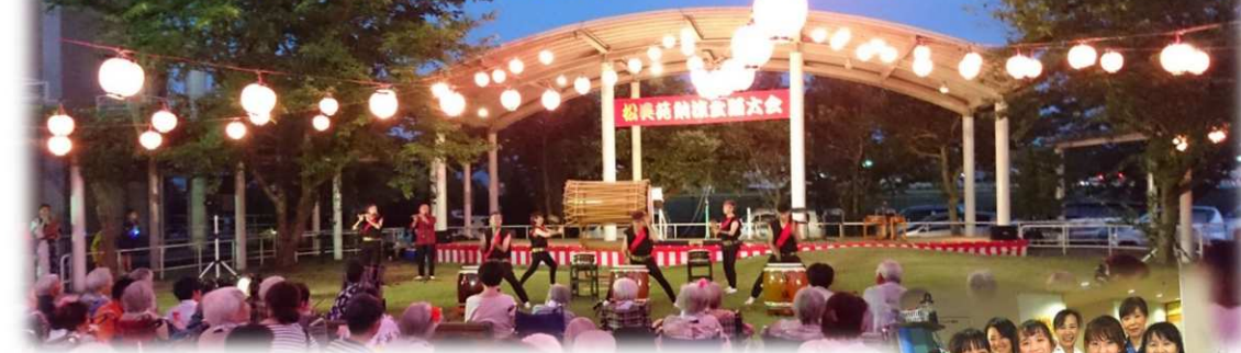
←空間弓堀太鼓様による アトラクション演奏