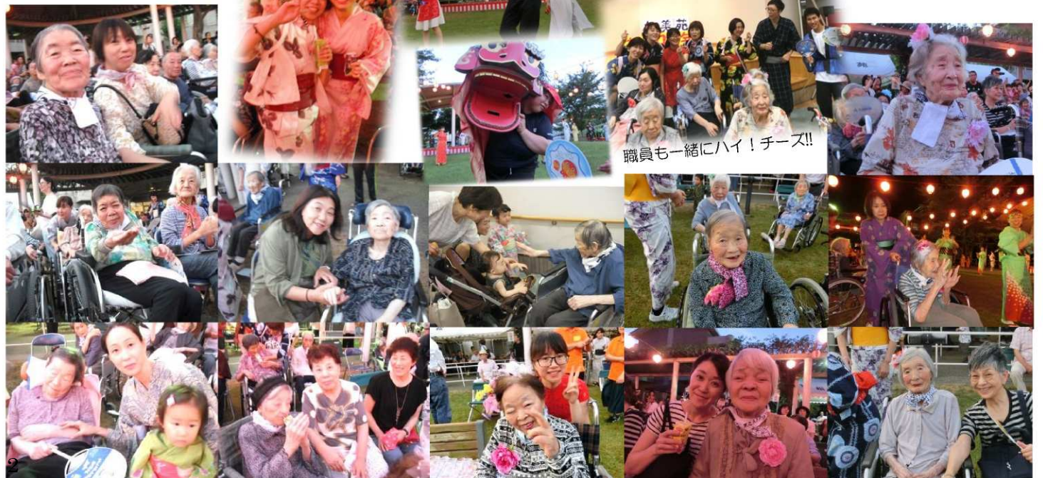
職員も一緒にハイ！チーズ!!