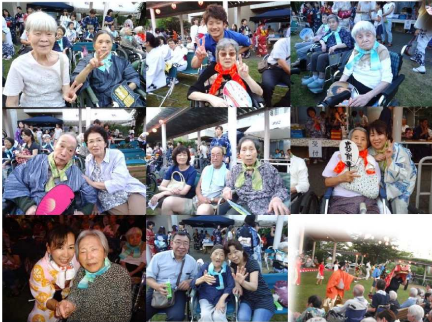
首に、ひんやり！保冷剤入りのタオルを巻いています。 当日は比較的涼しい日になり、ホッとしました。

先般、松美苑中庭におきまして開催いたしました「第20回松美苑納涼盆踊り大会」には、連日の酷暑でお疲れのところにもかかわらず、沢山の御家族様方にお越し頂き、ありがとうございました。 今年は夕方でも酷暑が心配され、少しでも涼しくなってから…との思いで開始時間を15分遅らせました。当日、その時間になってからのお知らせにて御家族様にはたいへんご迷惑をお掛けしましたこと、本当に申し訳なく思っております。 お陰様で体調を崩される方が出ることなく、無事大盛況のうちに終了することができました。 これからも皆様とのふれあいを大切に職員一同さらに研鑽してまいります。