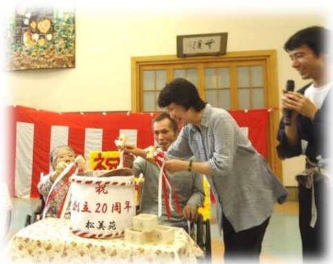
創立 20 周年を記念して、施設長と代表の皆様にご鏡割りをさせていただきました。