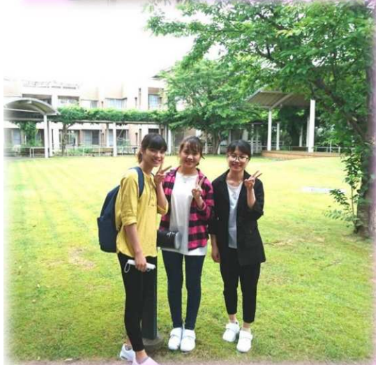
本当に3人も細い！かわいい！！ 日本語 めきめき上達中です♪