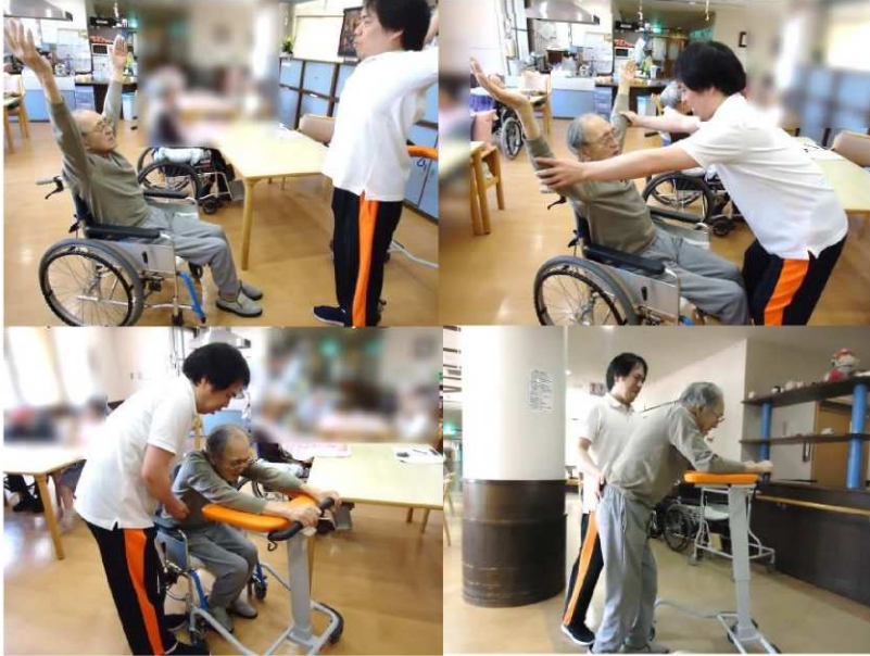
歩行するにあたっては、おひとり御一人の状況・状態等に合わせ、必要な準備体操などを行ってから、取り組んでいます。

自立支援介護における重要ケア『運動』。日々の生活の中に、無理ない範囲で歩行練習を取り入れ、歩行能力の向上に取り組んでいます。歩行することで、腸の働き&脳の働きが活性化し、便通を良くしたり意識レベルが向上したりと多くの効果が期待出来ます。