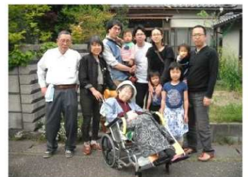
ご家族様皆さんが、出迎えてくださいました。