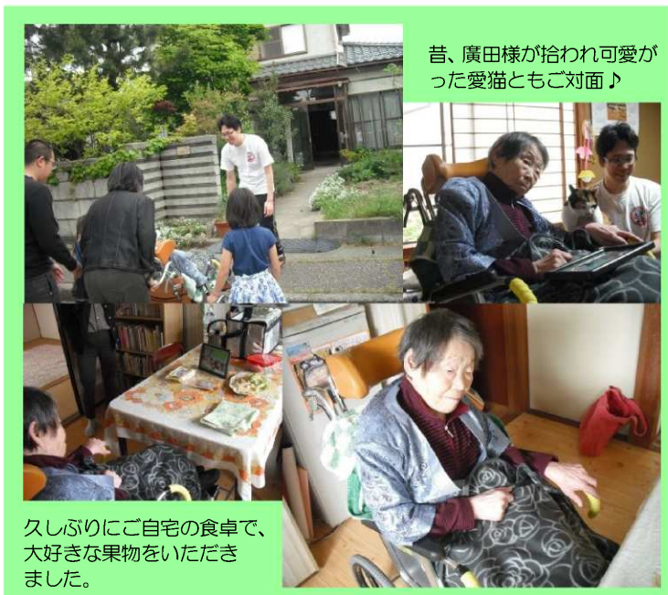
昔、廣田様が拾われ可愛がった愛猫ともご対面♪

松美苑では、おひとり御一人の気持ちに沿うべく、『たった一人、かけがえのないあなたへ』の思いを、形や気持ちにして伝えます と題して、その方の好きなこと・ずっと大切にしてくれたこと、またご家族様が叶えてあげたいと思っていること等、松美苑にお身体を置いておられても願い(思い)が叶うようお手伝いをしていきたいと考えております。