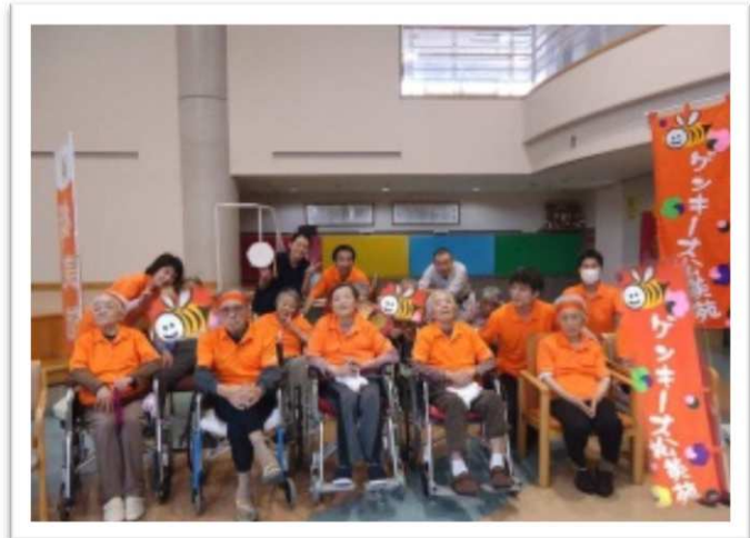
「ゲンキーズ松美苑」チーム全員で、ハイ！チーズ♪