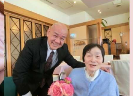
グランドホテル白山にて。テーブルセッティングもデザート皿も、とても可愛く仕上げてくださいました♪