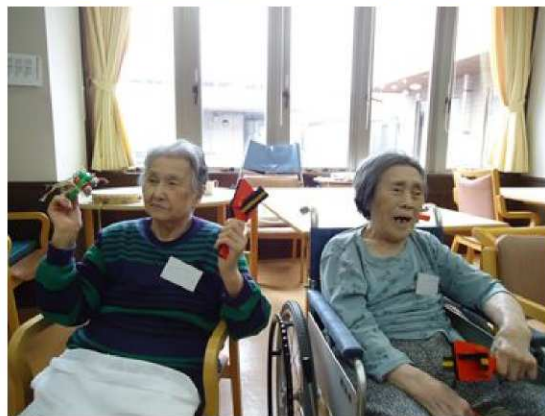
先生の伴奏に合わせて、皆さんで合唱したり、鈴・鳴子を振り身体を動かします。季節を感じる歌・懐かしい流行歌などに、昔のことなど思い出して会話も弾む楽しい時間です♪