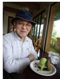
いい笑顔〜♪ 美味しそう〜♪♪

お出かけの醍醐味！フィッシュランド横のカフェでデザートも堪能してきました。 楽しんだ後のおやつは格別だそうですね♪